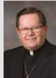
CARDINAL GÉRALD C. LACROIX

En terminant certains ont souhaité que les grandes confessions se réunissent dans un projet commun. ●