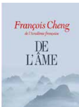
FRANÇOIS CHENG, De l'âme , Paris, Albin Michel, 2016.

L'auteur, né en Chine, a reçu au cours de sa carrière de nombreux et prestigieux prix pour ses essais, poèmes et romans ainsi que le Grand prix de la Francophonie pour l'ensemble de son œuvre. Il occupe un fauteuil à l'Académie française depuis 2002.