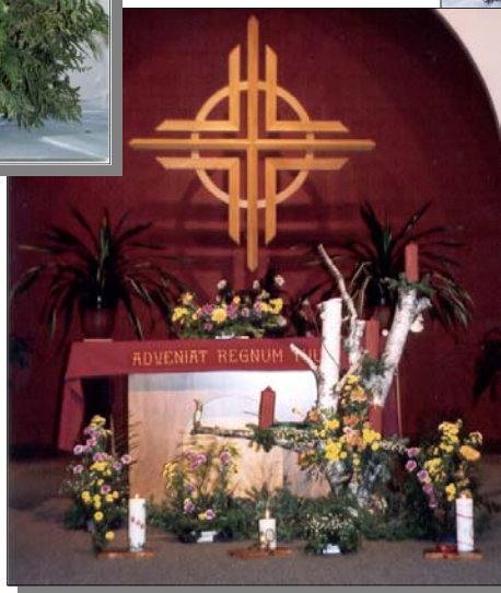
Le fruit de notre travail