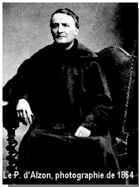
Le P. d'Alzon, photographie de 1864

150 ans après les commencements, notre amour de Dieu et de l'homme continue à nous mobiliser. " L'Esprit de notre fondateur nous pousse à faire nôtres les grandes causes de Dieu et de l'homme, à nous porter là où Dieu est menacé dans l'homme, et l'homme menacé comme image de Dieu " (RV 4).