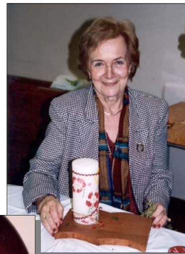
Décoration de bougie